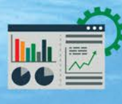
Real Time Monitoring