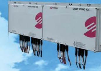
SMART STRAIN BOX