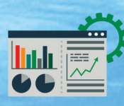
Real Time Monitoring